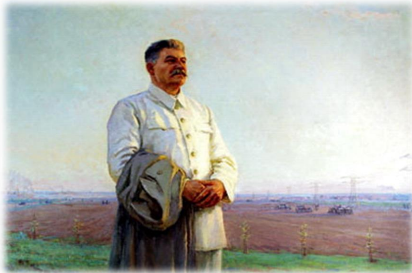
«Утро нашей Родины»

Таланту художника подвластны все жанры. Ф. С. Шурпин автор исторических и бытовых композиций, портретов, пейзажей, натюрмортов. Любовь к родной земле, жизнелюбие, тонкий лиризм, высокое профессиональное мастерство живут в его полотнах. Художник часто приезжал на родину, жил и работал в д. Рудня (ныне Ершицкого района, Смоленской области).