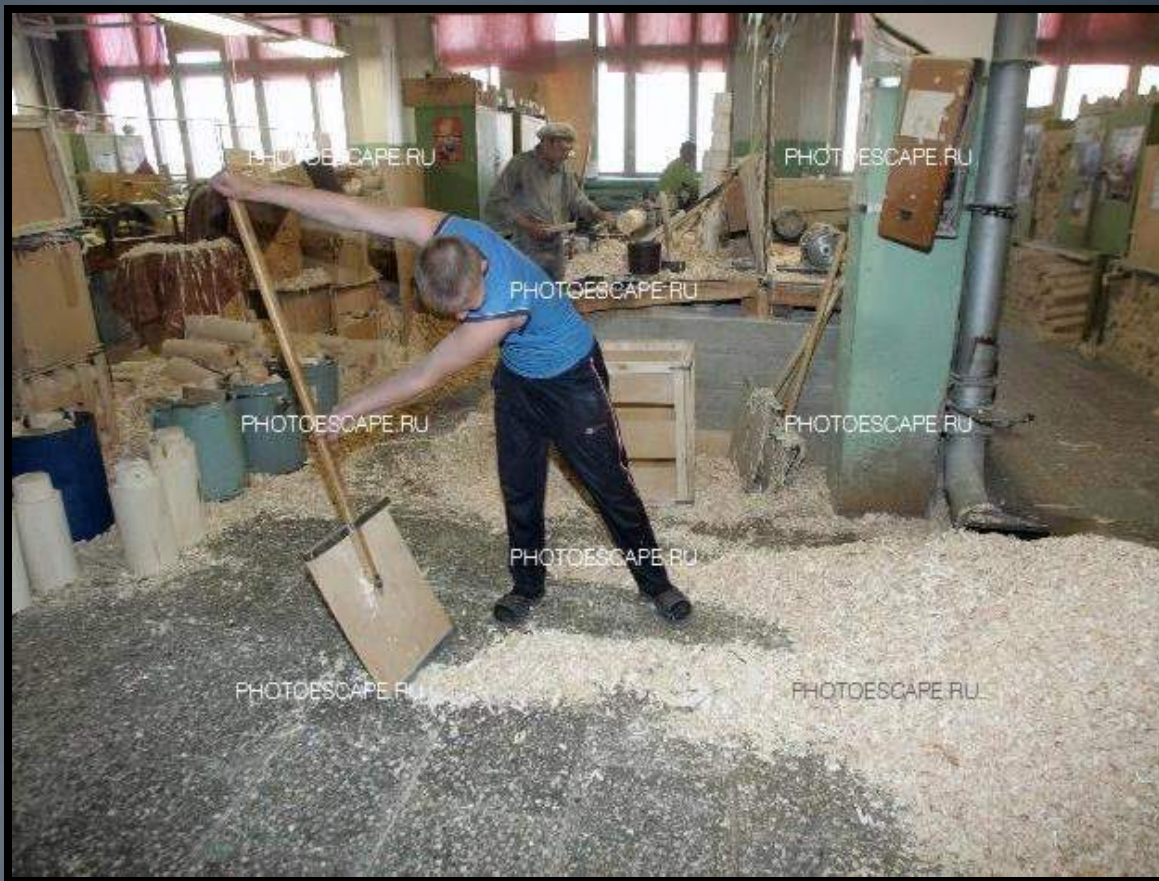
Современный токарный цех.