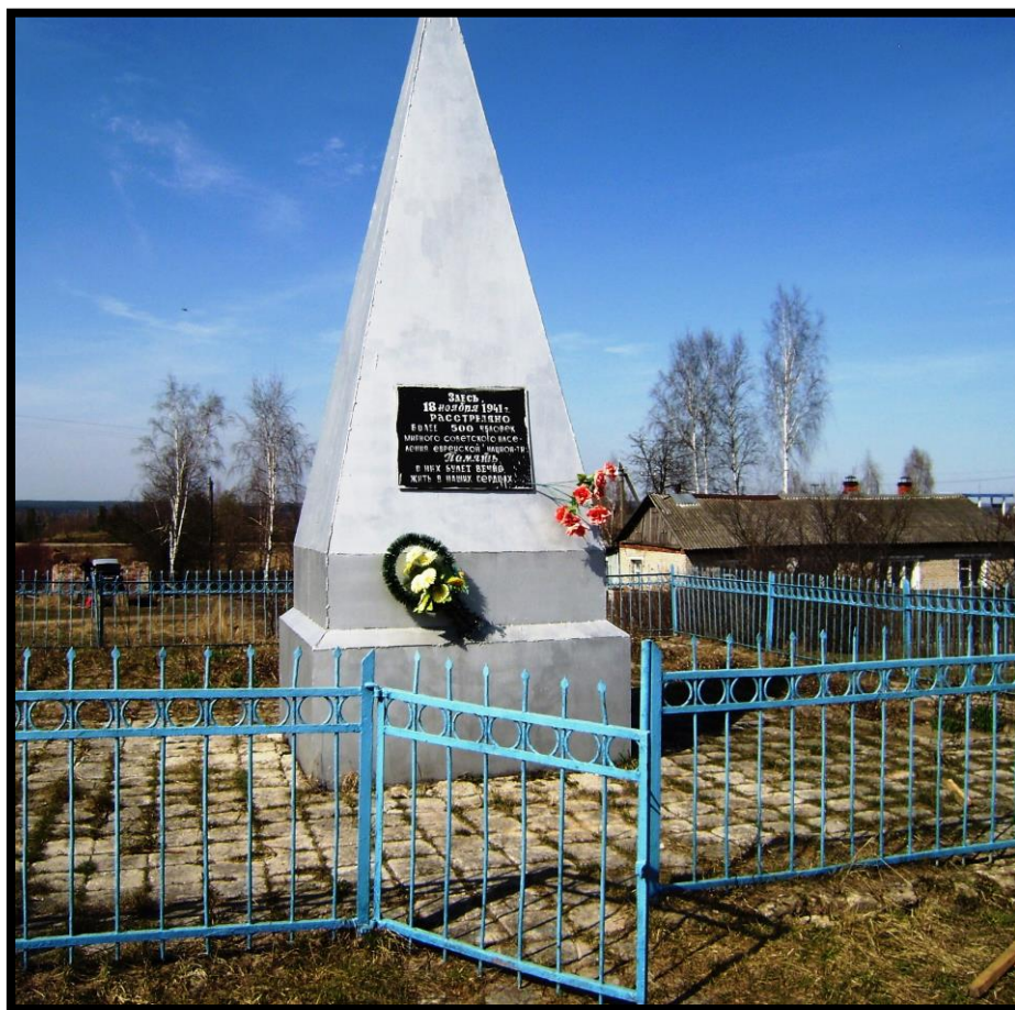
Братская могила на месте расстрела советских граждан еврейской национальности фашистами.