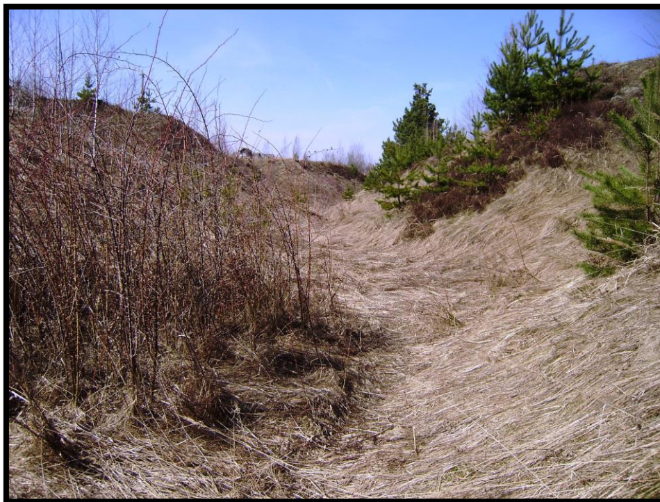
Галютин ров 2015 г. Место расстрела.