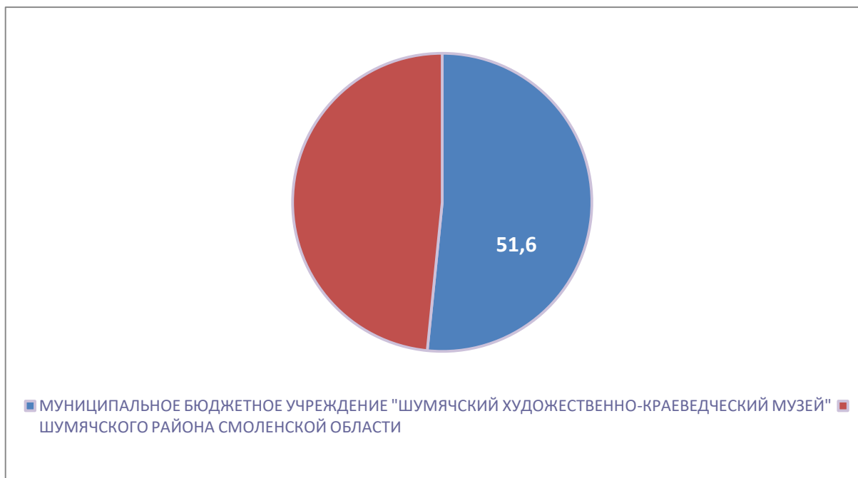
Рисунок 3 – Интегральный показатель по критерию «Доступность услуг для инвалидов»

По третьему критерию «Доступность услуг для инвалидов» МУНИЦИПАЛЬНОЕ БЮДЖЕТНОЕ УЧРЕЖДЕНИЕ "ШУМЯЧСКИЙ ХУДОЖЕСТВЕННО-КРАЕВЕДЧЕСКИЙ МУЗЕЙ" ШУМЯЧСКОГО РАЙОНА СМОЛЕНСКОЙ ОБЛАСТИ набрало 51,6 балла (Рис.3).