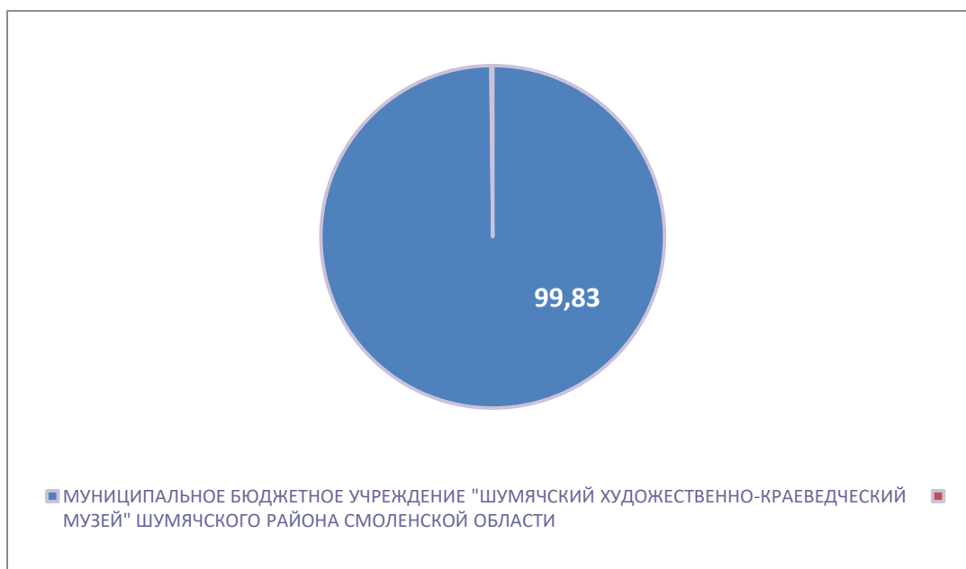
Рисунок 4 – Интегральный показатель по критерию «Доброжелательность, вежливость работников организации»

По четвертому критерию «Доброжелательность, вежливость работников организации» МУНИЦИПАЛЬНОЕ БЮДЖЕТНОЕ УЧРЕЖДЕНИЕ "ШУМЯЧСКИЙ ХУДОЖЕСТВЕННО-КРАЕВЕДЧЕСКИЙ МУЗЕЙ" ШУМЯЧСКОГО РАЙОНА СМОЛЕНСКОЙ ОБЛАСТИ набрало 99,83 балла (Рис. 4).