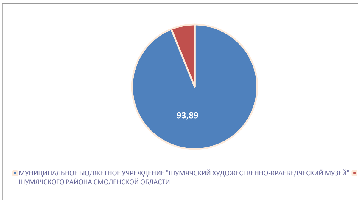
Рисунок 1 – Интегральный показатель по критерию «Открытость и доступность информации об организации культуры»

По первому критерию «Открытость и доступность информации об организации культуры» МУНИЦИПАЛЬНОЕ БЮДЖЕТНОЕ УЧРЕЖДЕНИЕ "ШУМЯЧСКИЙ ХУДОЖЕСТВЕННО-КРАЕВЕДЧЕСКИЙ МУЗЕЙ" ШУМЯЧСКОГО РАЙОНА СМОЛЕНСКОЙ ОБЛАСТИ набрало 93,89 балла (Рис.1).